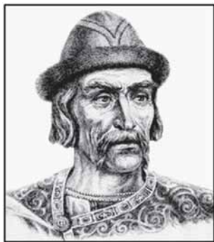
Великий князь Киевский Ярослав Мудрый

Правление Ярослава Мудрого (1019–1054) считается порой наивысшего расцвета государства под названием Русь. При нем Киев стал культурным, интеллектуальным и религиозным центром восточнославянского мира: Русскую церковь стал возглавлять митрополит Киевский, посвящаемый в сан патриархом Константинопольским. Ярослав строил города и церкви, развивал ремесла. Русь вела торговлю со Скандинавией, Византией, Западной Европой, народами Кавказа и Средней Азии.