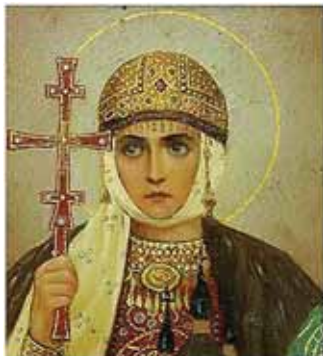
Мать Святослава, Великая княгиня Киевская Ольга