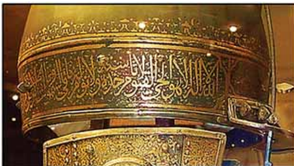
Шлем «великого русского правоверного» Александра Невского с молитвой из Корана