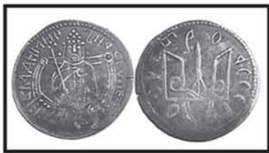
Монеты князя Владимира

Кровь великих киевских князей текла тогда в жилах правителей Французского и Венгерско-Хорватского королевств, Великого княжества Литовского, Болгарского и Грузинского царств, Австрийского герцогства, Норвегии... Русь — это было действительно великое государство — отсюда и такое желание у появившихся потом московитов увязать свою историю с историей Руси, а фактически Украины