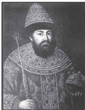
Московский князь Иван I Калита

Московский улус Золотой Орды был основан по приказу монгольского хана Менгу-Тимура в 1277 году (через пять лет после последней переписи монголов). Возник этот улус на территории Суздальского княжества, а первым его правителем монгольский хан Менгу-Тимур назначил сына Александра Невского 16-летнего Даниила, который, согласно монгольским законам, так же,