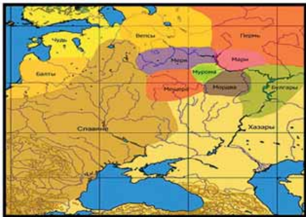
Карта с указанием мест обитания славян, финно-угров и других народов в XI веке