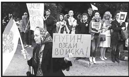
Пророссийская «пятая колонна» в действии!..

Из-за своей безумной веры в «светлое будущее» и маниакального желания вернуться в «счастливое» советское прошлое то, выжившее из ума, население Донбасса, боготворит тирана Сталина, во времена правления которого погибло украинцев больше (пропорционально численности населения), чем в любой другой стране мира, после Камбоджи. И символы той умершей страны в своих так называемых республиках ДНР и ЛНР эти люди возрождают; и методы по «наведению порядка» в тех своих псевдореспубликах они используют такие же, как и