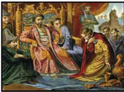
«Защитник русской земли» Александр Невский перед монгольским ханом на коленях челом бьет