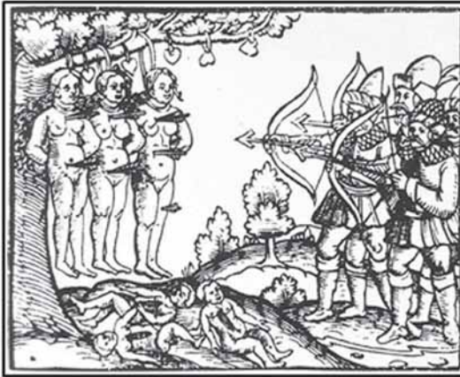
Гравюра XVI века. 1558–1583 гг. Moscovite atrocities in Livonia, XVI century. Зверства москвитов на территории Ливонии в XVI веке

государства, традиции, политика и стремления которого были настолько противоположны традициям, политике и стремлениям современной России, что последняя смогла утвердить свое существование лишь на его развалинах».