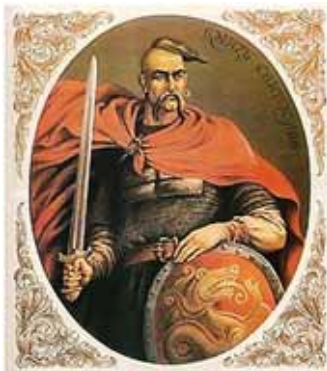
Великий князь Киевский Святослав Игоревич