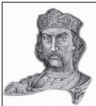
Великий князь Киевский Владимир Святославович

Далеко не святым был до своего крещения и ее внук Владимир — третий сын Великого Киевского князя