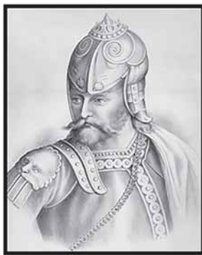
Великий князь Литовский Гедимин

нерусские земли с городами Гродно, Витебск, Полоцк, Минск, Берестье и другие. Искал защиты в Литве и Новгород, но мы уже знаем, что с этим городом сделали московские князья Иван III и Иван IV (Грозный). Хотел и Смоленск не платить дань монголам, перейдя под власть Великого княжества Литовского (славянского государства), да наместник монгольского хана на московском княжеском троне Иван I Калита огнем и мечом не позволил смолянам сделать это — он сохранил за монголами славянскую землю Смоленска и жители этого бело-