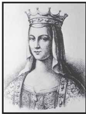
Киевская княжна и королева Франции Анна Ярославна

Ярослав Мудрый породнился с множеством правящих династий Европы. Например, второй его женой была дочь короля Швеции. Уже упоминаемая мной его дочь Анна, выйдя замуж за французского короля Генриха I, стала королевой Франции; дочь Елизавета была королевой Норвегии, Анастасия — королевой Венгрии. Четвертый сын Ярослава Мудрого Всеволод Ярославович (после смерти отца — Великий князь Киевский) имел в женах дочь византийского императора Мономаха. Это их сын потом станет Великим князем Киевским Владимиром Мономахом. Внучка Ярослава Мудрого и дочь его сына Всеволода Ярославови-