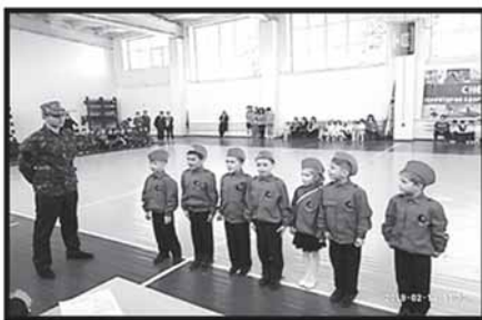
«Юные патриоты ДНР»

продолжать гадить Украине во имя «великой России»! О многом говорит и то, что на территории оккупированного Донбасса сейчас активно создаются так называемые «военно-патриотические движения», задачей которых является подготовка детей к «защите своей родной земли» от