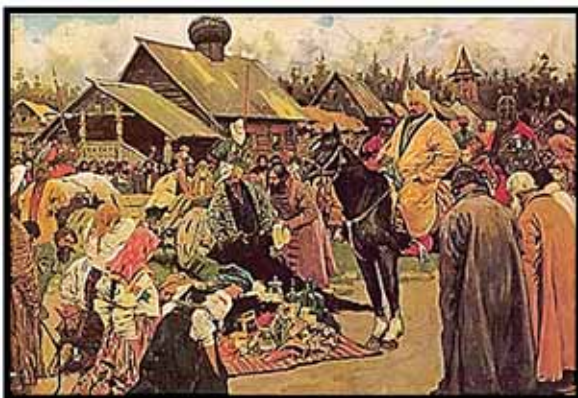
С. В. Иванов. «Баскаки». 1909 г.