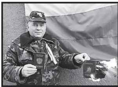
Любитель «русского мира» демонстративно сжигает свой украинский паспорт