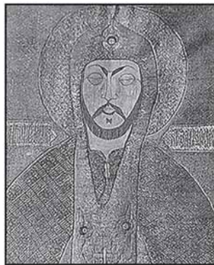
Фрагмент покрыва с изображением Александра Невского. 1263 г.